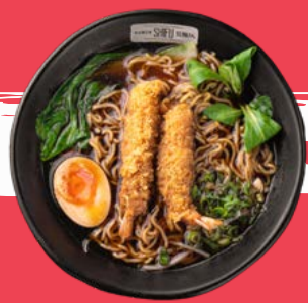
EBI TEMPURA RAMEN 13,5

House broth with cream sauce, noodles, pakchoi, crispy duck, nori seaweed, bamboo, naruto, soft boiled eggs, chives, soy sprouts