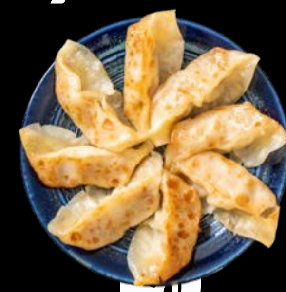
RAVIOLI DI CARNE BOLLITI 9

Ravioli di carne bolliti (10pz) serviti con brodo alla salsa shoyu erba cipollina sedano e alga nori tritata