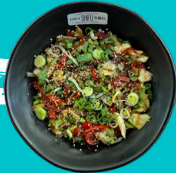
YAKISOBA VEGETALE 9

Rice noodles with peanuts, egg, black and white sesame soy sprouts, coriander and lime