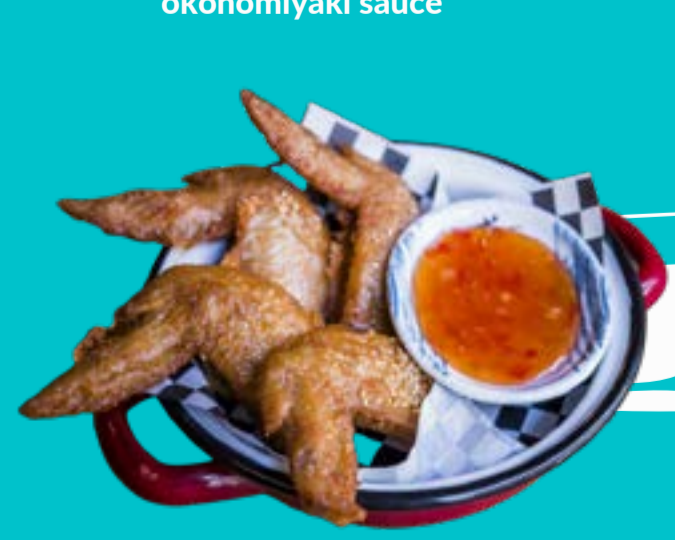
SHIBUYA WINGS 4,5

Grilled bao stuffed with crispy duck strips, peanuts served with hoisin sauce