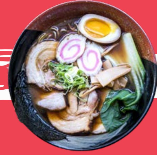
SHOYU RAMEN 11,5

Original house broth. Noodles pakchoi, marinated pork, nori seaweed, bamboo, soft boiled naruto eggs, chives, soybean sprouts