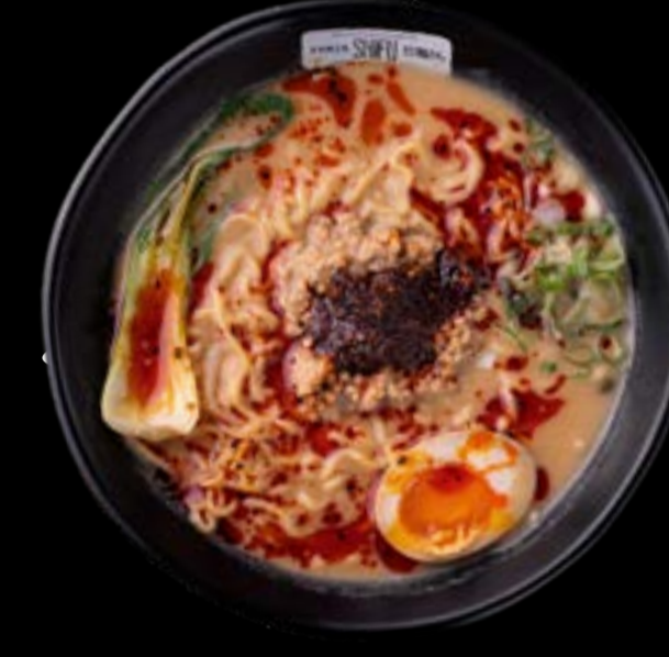
TAN TAN RAMEN 13

Brodo della casa con aggiunta di salsa piccante tan tan, noodles, pakchoi, carne trita speziata, uova alla coque, erba cipollina, germogli di soia, salsa di arachidi