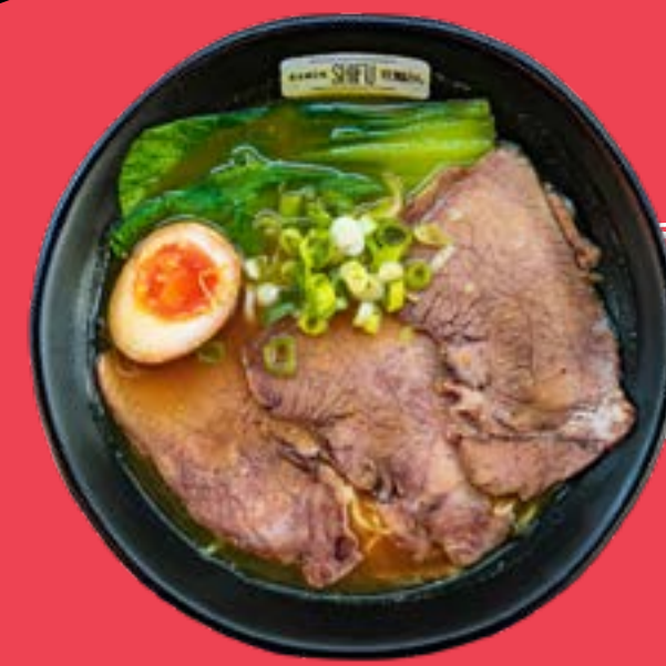
BEEF CURRY RAMEN 13,5

Noodles with beef, Chinese pak choy cabbage, red onion, soybean sprouts, valerian, chili, egg and chives, served with traditional broth.