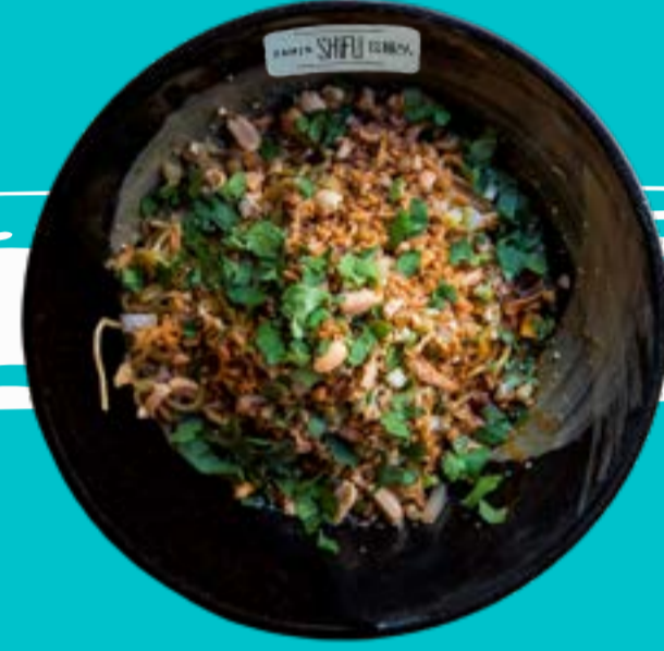
MAZESOBA PINATTSU 10

Noodles with chashu (spiced pork) eggs, peanuts, fried onion, soybean sprouts, chives, cilantro, celery