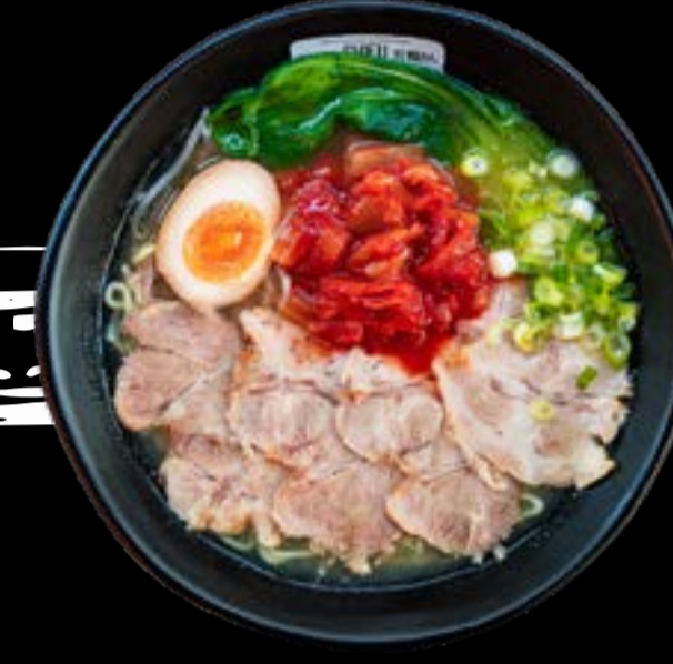
KIMCHI RAMEN 13,5

House broth with added spicy tan sauce, noodles, pakchoi, spicy minced meat, soft boiled eggs, chives, soybean sprouts