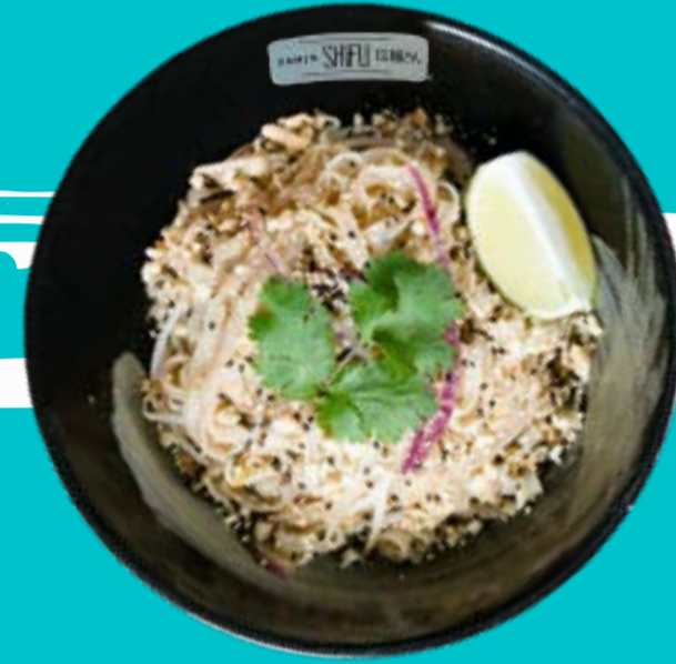
PAD THAI 9,5

Japanese noodles, ground pork, soybean sprouts, peanuts, fried onion, celery, chives, cilantro