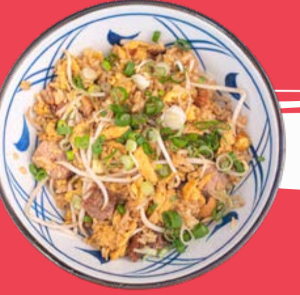
RISO KIKU 9,5

Stir-fried rice with chashu (spiced pork) veal, chives and scrambled eggs