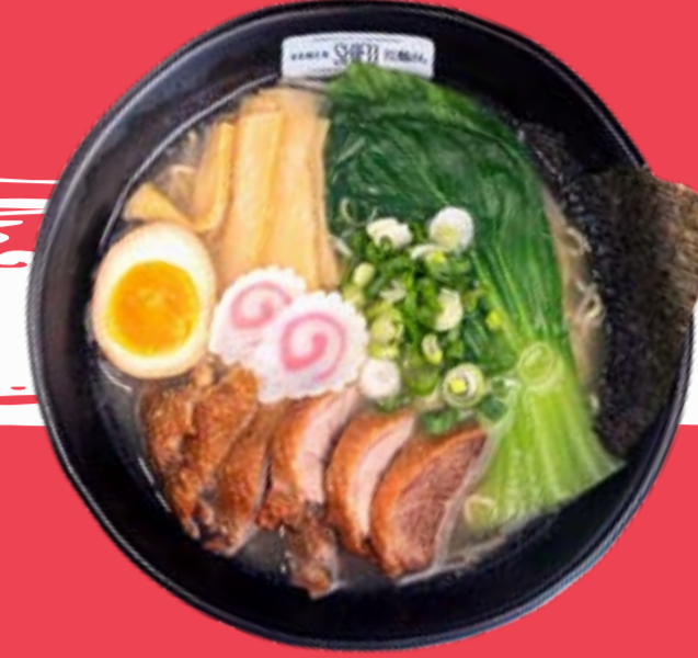
RAMEN DI ANATRA 14

Vegetable broth with miso sauce, noodles, pakchoi, nori seaweed, bamboo, soft boiled eggs, chives, mushrooms, soy sprouts