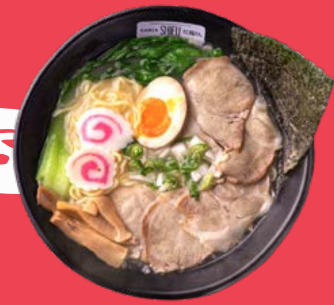
MISO RAMEN 11,5

Original broth with shoyu sauce base, noodles, pakchoi marinated pork, nori, bamboo, naruto soft boiled eggs, chives, soy shoots