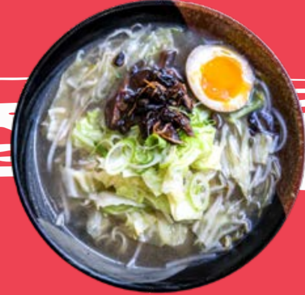
YASAI RAMEN 11

Noodles with fried chicken slices, Chinese pak choy cabbage, naruto, soybean sprouts, bamboo, nori seaweed, egg, mushrooms, and chives served with traditional broth