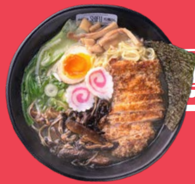
FRIED CHICKEN RAMEN 12,5

Spaghetti con fette di pollo fritto, cavolo cinese pak choy, naruto, germogli di soia, bambù, alga marina nori, uovo, funghi ed erba cipollina servito con brodo tradizionale