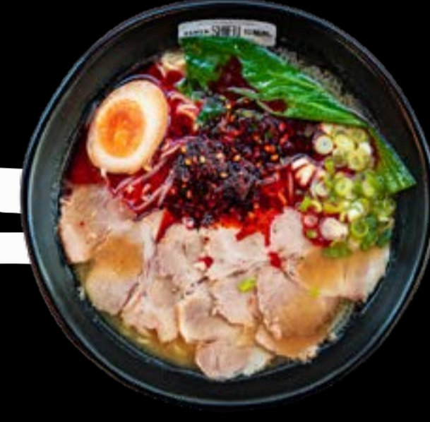
INFERNO RAMEN 13,5

Noodles with spicy marinated cabbage, soybean sprouts, chashu pork belly, Chinese pak choy cabbage, kimchi, egg and chives, served with traditional broth