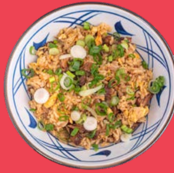
RISO SAKURA 8,5

Riso saltato con chashu (carne di maiale speziata), vitello, erba cipollina e uova strapazzate