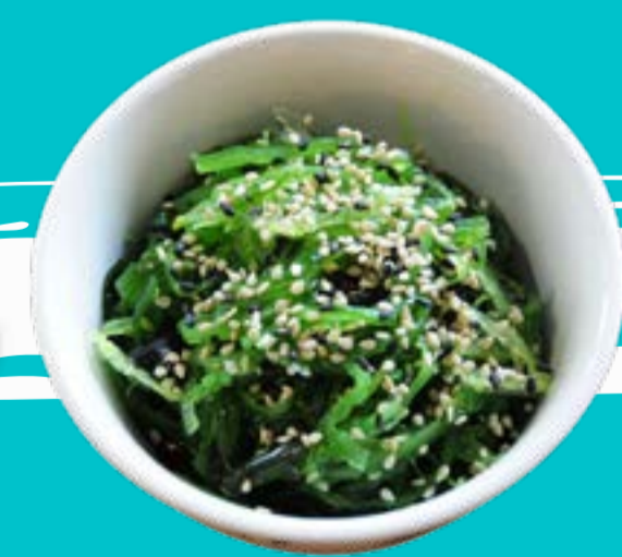
GOMMA WAKAME 3

Meatballs stuffed with potatoes and squid with mayonnaise and okonomiyaki sauce