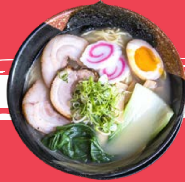
TONKOTSU RAMEN 11,5

Original broth and curry. Japanese noodles with beef, pak choy cabbage, egg and chives