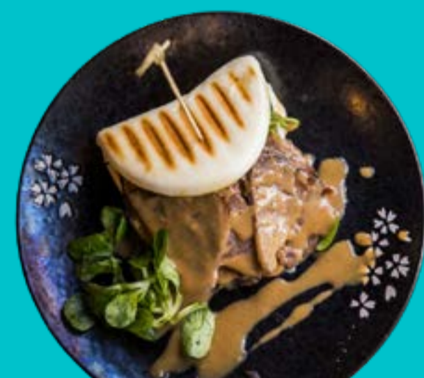
BAO DI POLLO 4,5

Bao alla piastra ripieno di pollo fritto croccante, arachidi, servito con salsa tonkatsu