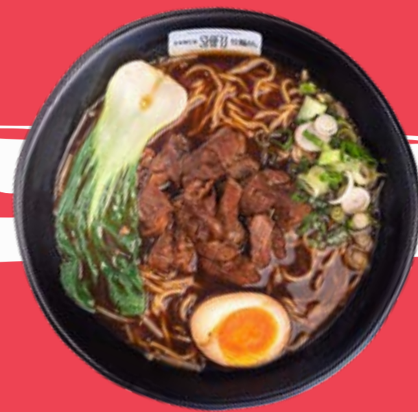
SHICHU RAMEN 13,5

House broth with shoyu sauce. Noodles, pakchoi, tempura shrimp, soft boiled egg, chives, soybean sprouts