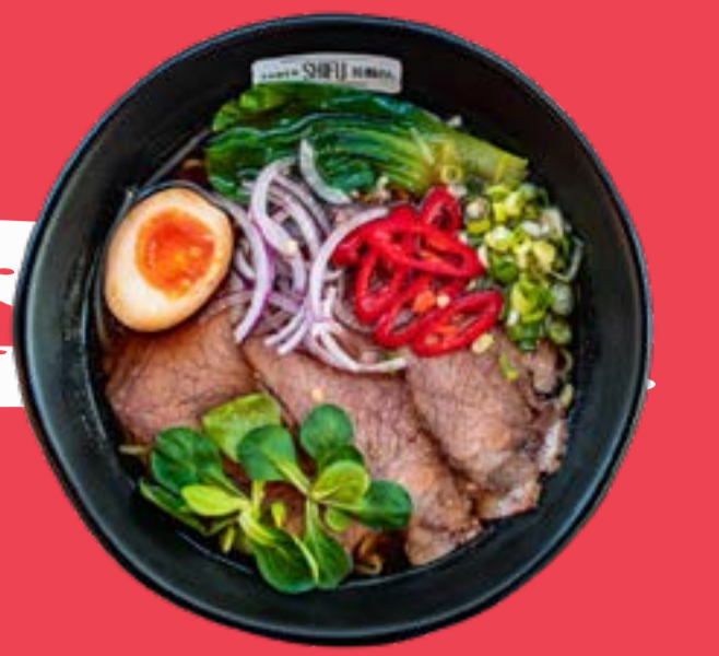
BEEF RAMEN 12,5

Home made broth with shoyu sauce, noodles, stewed beef cubes, soft boiled eggs, chives, soy sprouts and pakchoi