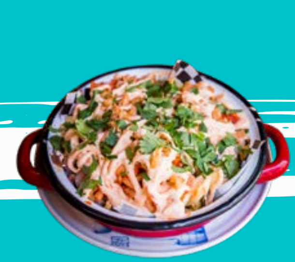
CHASHU BEEF FRIED 5

Crispy chicken wings marinated with 5 spices, ginger, soy, served with sour-spicy sauce.