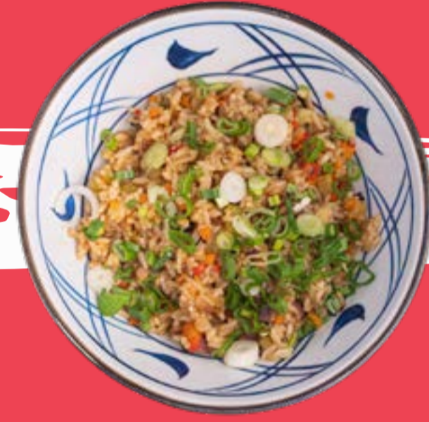
RISO VERDURE AL CURRY 8,5

Rice with chicken scrambled eggs, chives, red onion and chopped nori seaweed